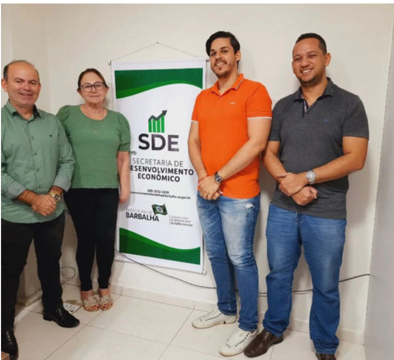
Reafirmação do contrato do Programa Cidade Empreendedora

Prefeitura Municipal de Barbalha por meio da Secretaria de Desenvolvimento Econômico renovou em 2023 a parceria com o SEBRAE/CE para continuidade das ações do programa CIDADE EMPREENDEDORA para trabalhar eixos importantes para melhorar o ambiente de negócios e atração de novos empreendimentos para o município. As ações estão voltadas para a desburocratização no ato do registro das empresas, compras governamentais com intuito de ampliar as oportunidades de compressa da Prefeitura aos pequenos negócios sediados no município, Educação Empreendedora com a ampliação de escolas, professores e alunos engajados no projeto JEPP – Jovens Empreendedores Primeiros passos, onde são ensinados os fundamentos para a educação empreendedora para alunos do ensino fundamental, fortalecimento das Lideranças Locais para a conexão destes com o projeto de desenvolvimento municipal e Regional, e outras ações importantes para o fortalecimento de setores econômicos chaves do município, como o turismo e o comércio.